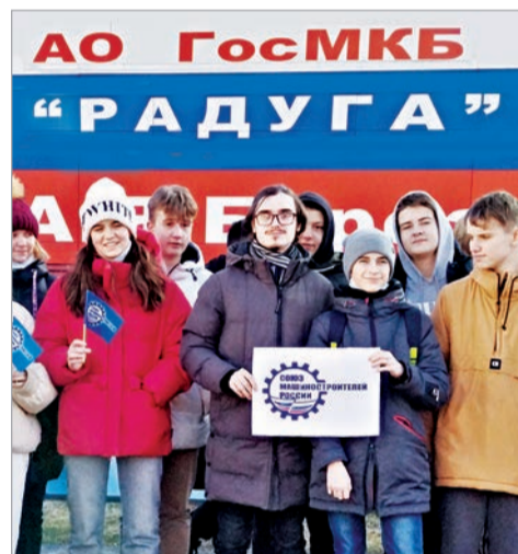
Школьники в ГосМКБ «Радуга»

ственные корпуса, где берут свое начало будущие изделия. В ходе экскурсии до них также доводят и информацию о наборе на целевое обучение по специальностям.