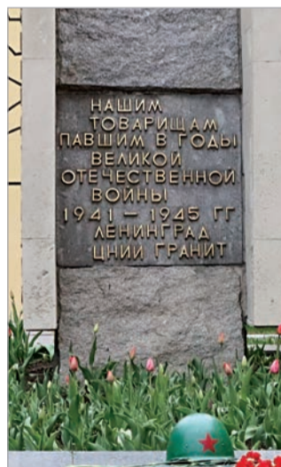
► Возложение цветов к памятнику погибшим в годы Великой Отечественной войны в АО «Концерн «Гранит-Электрон»

По информации, предоставленной предприятиями