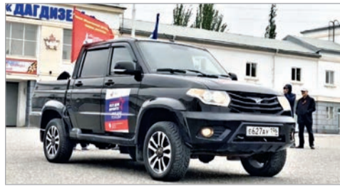
► УАЗ «Патриот» был куплен работниками Завода «Дагдизель» и отправлен в Донбасс и Луганск

Работники Завода «Дагдизель» (входит в КТРВ, Республика Дагестан – г. Каспийск) приобрели на свои средства и передали бойцам РФ в зоне специальной военной операции «УАЗ-Патриот». Торжественное вручение ключей