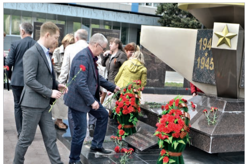
► Пермский завод «Машиностроитель» (входит в КТРВ, г. Пермь): помним, гордимся!