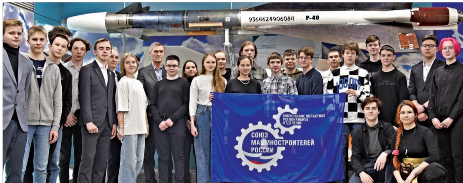
Экскурсия учащихся Преуниверсария МАИ на головном предприятии Корпорации в рамках акции «Неделя без турникетов»

– один из ведущих проектов Союза машиностроителей России, реализуемых на предприятиях КТРВ