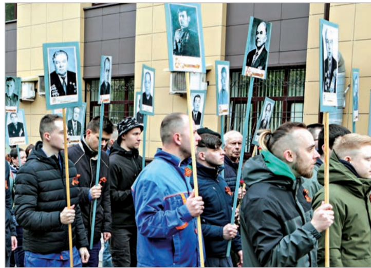
► Шествие Бессмертного полка в ГосМКБ «Вымпел» им. И.И. Торопова

После минуты молчания состоялось возложение цветов к мемориалам, посвященным ратному и трудовому подвигу работников предприятия.