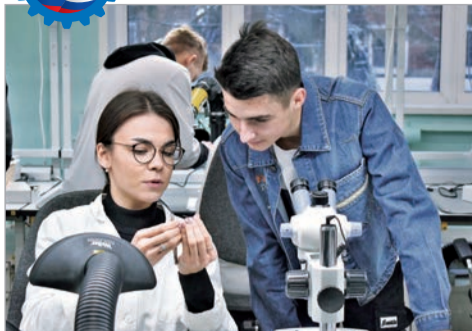
Акция проходит в ЦКБА

«Неделя без турникетов» представляет собой комплекс мероприятий, направленных на профориентационное информирование молодежи о ведущих предприятиях России, популяризацию профессий и специальностей, востребованных на промышленном производстве. Они позволяют школьникам и студентам ещё во время учебы познакомиться с работой предприятий, расположенных в регионе. О важности этой всероссийской акции говорил в своём выступлении перед молодыми специалистами АО «ВПК «НПО машиностроения» (входит в КТРВ, г. Реутов Московской обл.) в рамках федерального просветительского марафона «Знание. Первые» заместитель Председателя Совета безопасности РФ, заместитель председателя Военно-промышленной комиссии РФ Дмитрий Медведев.