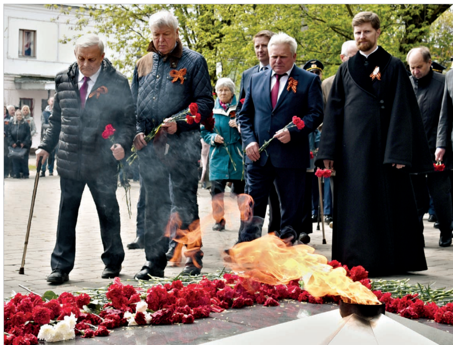
Митинг на головном предприятии Корпорации

На предприятиях Корпорации «Тактическое ракетное вооружение» прошли мероприятия, посвящённые 78-й годовщине Победы в Великой Отечественной войне