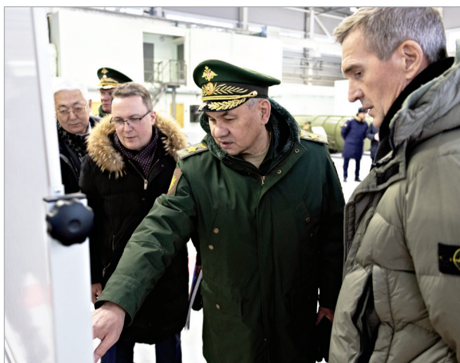
► В ГосМКБ «Радуга» им. А.Я. Березняка