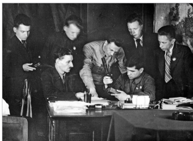
Руководство завода. Собираются у дирекционного стола 1942г.

Руководство принимало меры по поддержке не только заводчан, но и горожан. Специальная заводская молодёжная женская бригада обходила квартиры, где жили фронтовики, и оказывала их семьям посильную помощь. Для госпиталя на улице Блохина на заводе было налажено изготовление пе-