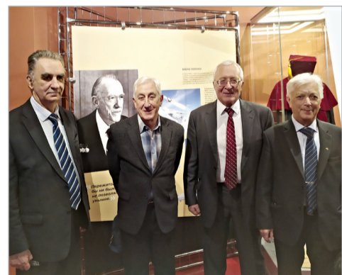
▶ Ветераны НПО «Молния», принимавшие участие в разработке «Бурана»