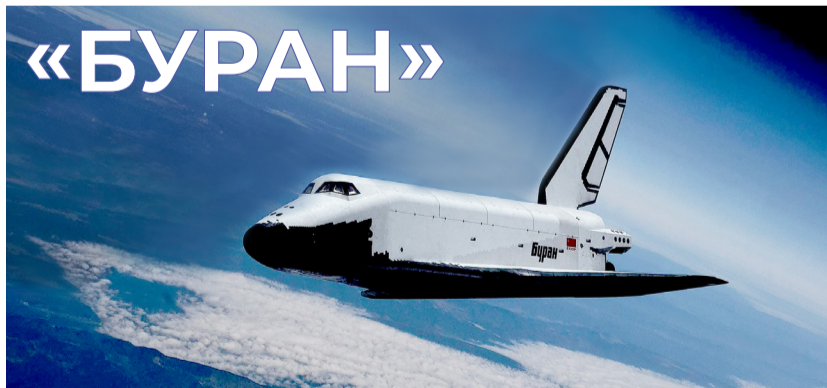
▶ «Буран» – первый советский беспилотник, совершивший автоматическую посадку на взлётно-посадочной полосе аэродрома

35 лет назад, 15 ноября 1988 года, ракета-носитель «Энергия» вывела на орбиту многоразовый орбитальный корабль «Буран». Спустя 205 минут, сделав два витка вокруг Земли, корабль успешно приземлился. В проекте «Энергия-Буран» принимали участие сотни КБ и заводов Советского Союза, в том числе НПО «Молния» (входит в КТРВ). На предприятии и сейчас работают специалисты, создававшие не только «Буран», но и предшествовавший ему проект орбитального самолёта «Спираль». Группу разработчиков тогда возглавлял талантливый авиаконструктор Глеб Евгеньевич Лозино-Лозинский.