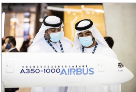
На выставке Dubai Airshow 2023

По материалам ТАСС, Российской газеты, других центральных СМИ