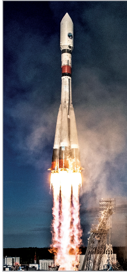
Запуск спутника дистанционного зондирования Земли «Кондор-ФКА» № 1

Созданием космических аппаратов дистанционного зондирования Земли АО «ВПК «НПО машиностроения» занимается с начала 1960-х гг. В числе первых была разработана орбитальная группировка космических аппаратов радиолокационной разведки «УС-А» и радиотехнической разведки «УС-П». СССР стал первой в мире страной, которая вывела на орбиту радиолокационную станцию обзора водной поверхности и обнаружения надводных кораблей с осуществлением автоматической обработки информации и передачи её на подводные лодки, надводные корабли и наземные пункты. В эти же годы прорабатывались и вопросы создания разведывательной орбитальной пилотируемой станции (ОПС). Эта масштабная задача была поручена в 1965 году Генеральному конструктору ОКБ-52 Владимиру Николаевичу Челомею. Тогда для ОПС «Алмаз» была разработана бортовая радиолокационная станция с синтезированной апертурой «Меч-А» для разведки в основном наземных объектов, что позволило контролировать ~ 80% поверхности Земли, где находятся практически все наиболее важные объекты или происходят военные