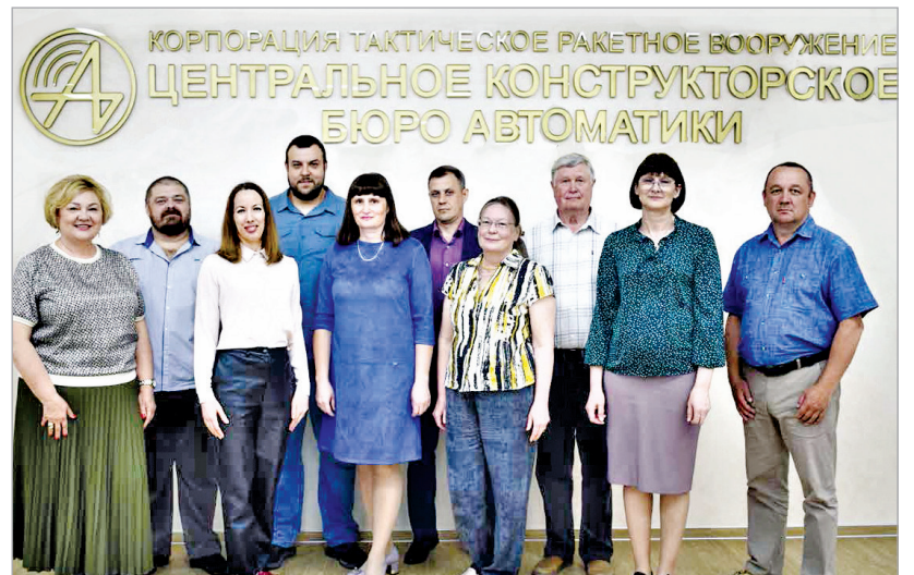
Специалисты и руководители ЦКБА, удостоенные Премии президента РФ