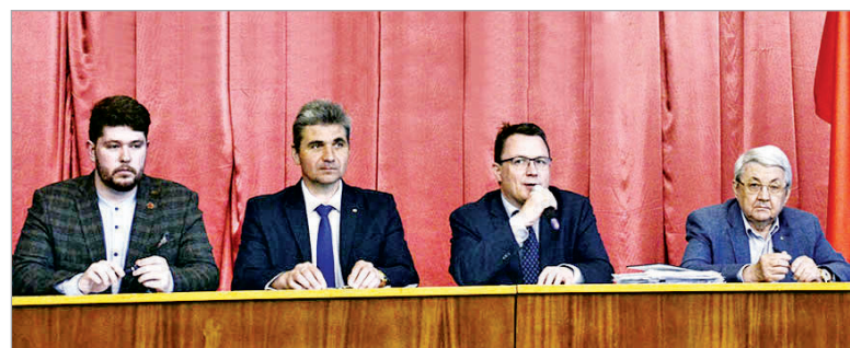
В президиуме – представители руководства предприятия: администрации, профсоюзной организации, Совета молодёжи

Генеральный директор, выступая, в частности, сказал, что на предприятии действует жилищная программа. Только в прошлом году ключи от квартир получили семьи молодых сотрудников на ул. Программистов, а спустя несколько месяцев на этой же улице было выделено жильё работникам в общежитии. В ближайшее время справят новоселье еще несколько десятков человек – в общежитии на улице Молодёжной. В настоящее время идет поиск вариантов нового стро-