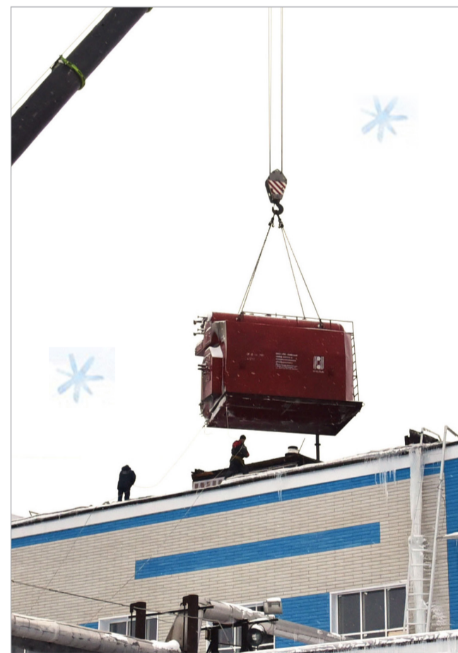
▶▶ Транспортировка новых паровых котлов ДЕ-10/14 в здание паровой котельной

– Главная наша задача – до 2025 года привести в соответствие техническую часть всех котлов, чтобы они долго и надёжно могли обеспечивать нас теплом. Венцом проекта станет полная диспетчеризация работы котельной. На это тоже разработан отдельный проект. Это произойдёт, когда мы введём в эксплуатацию все котлы, свяжем систему автоматизации с автоматизированным рабочим местом и появится возможность контролировать параметры работы котельной и управлять котлами. Котельная фактически полно-