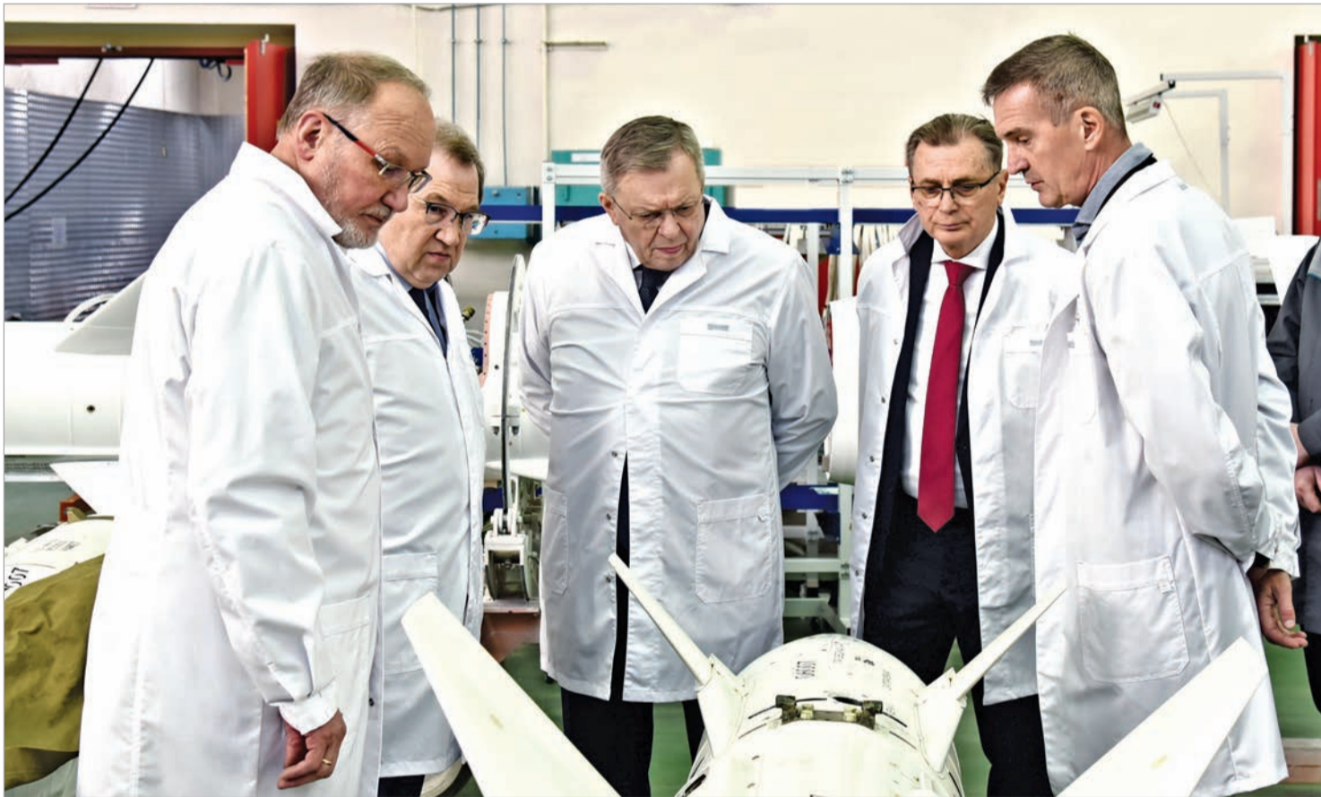
Делегация в одном из цехов головного предприятия Корпорации

Сознакомительным визитом головное предприятие КТРВ посетили представители РАН: президент Геннадий Красников, первый вице-президент Владислав Панченко и вице-президент Сергей Чернышев.