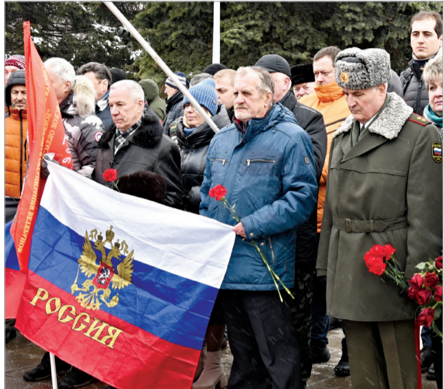
► Минута молчания

Представители головного предприятия Корпорации «Тактическое ракетное вооружение» приняли участие в городском митинге, посвящённом жителям города Королёва, воевавшим в Афганистане, многие из которых погибли в ходе военного конфликта